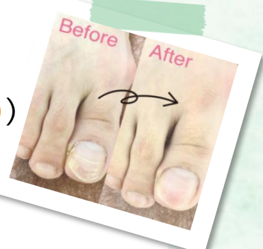
爪のカット、厚みや表面の段差を削り 爪の中の角質やゴミのお掃除もします!!