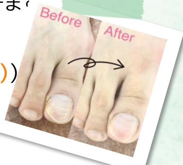
爪のカット、厚みや表面の段差を削り 爪の中の角質やゴミのお掃除もします!!