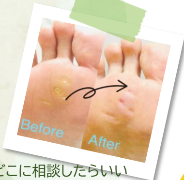
どこに相談したらいい かわからない 魚の目やタコ... ご相談ください!!