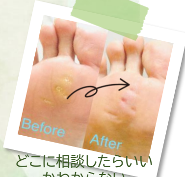
どこに相談したらいい かわからない 魚の目やタコ... ご相談ください!!