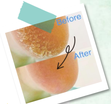
ガサガサかかとも こんなにきれいに!!