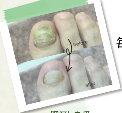
肥厚した爪、 ガタガタ段差の爪もきれいに整えます!!