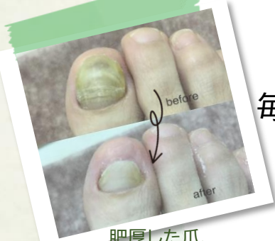
肥厚した爪、 ガタガタ段差の爪もきれいに整えます!!