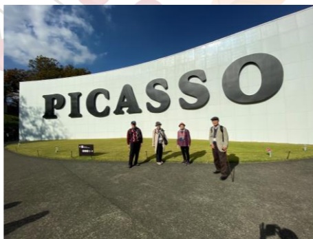
*前回の行先、箱根彫刻の森美術館です!!